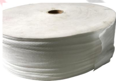
写真2：10kg 完成済みたロール