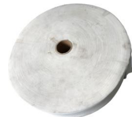
写真3：完成済みたロール (上面)

諸産業の使用の目的及び性質により違うので、当社の工場は顧客の要求のベストな応答及び生産の費用の削減を目指して諸顧客の要求により商品を調整する。