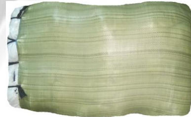
Hình 4: Bao thành phẩm