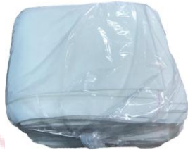
Hình 3: Túi thành phẩm