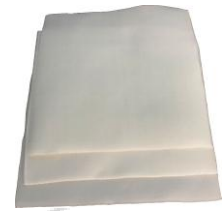
Hình 2: Sản phẩm thực tế